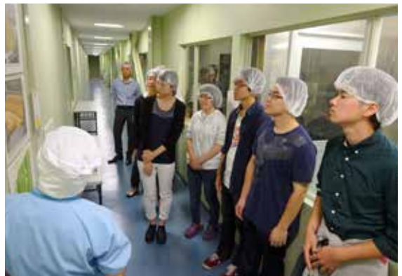
(株)みすずコーポレーションの本社工場