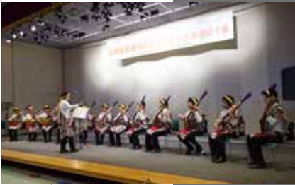
スコープ三味線演奏 (JAあづみ女性部)