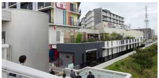
南医療生協の視察