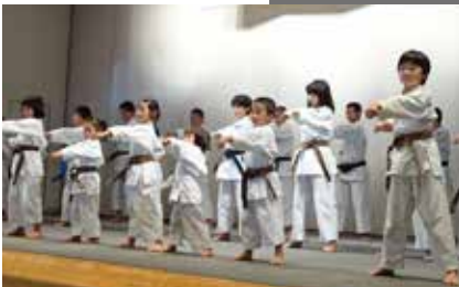
空手「型」披露(松本明誠会)