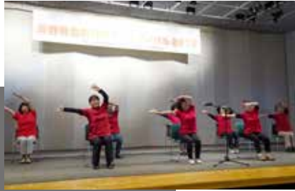
健康体操 (東信医療生協)