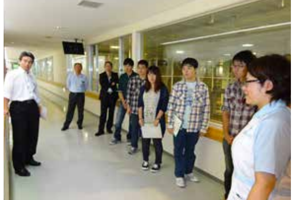
ゴールドパック(株)あずみ野工場

参加した学生委員からは「今まで意識することがなかった生協と一般のお店の違いに気づきました」「普通の生協は知ってが、医療生協なるものがあることは初めて知りました」などの感想が寄せられました。