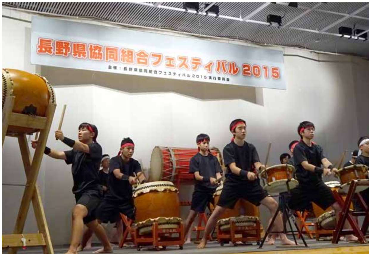
長野県協同組合フェスティバル2015オープニングセレモニーでの堀金中学校「常念太鼓」の演奏 長野県協同組合フェスティバル2015：関連資料は2～3ページに掲載