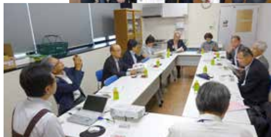
コープあいち上社店の視察