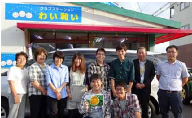
生活クラブ生協の岡谷ステーション「わい和い」