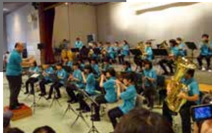
吹奏楽部演奏(堀金中学校)