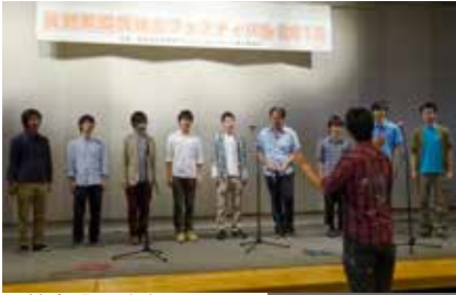
男性合唱団演奏 (信州大学グリーンクラブ)